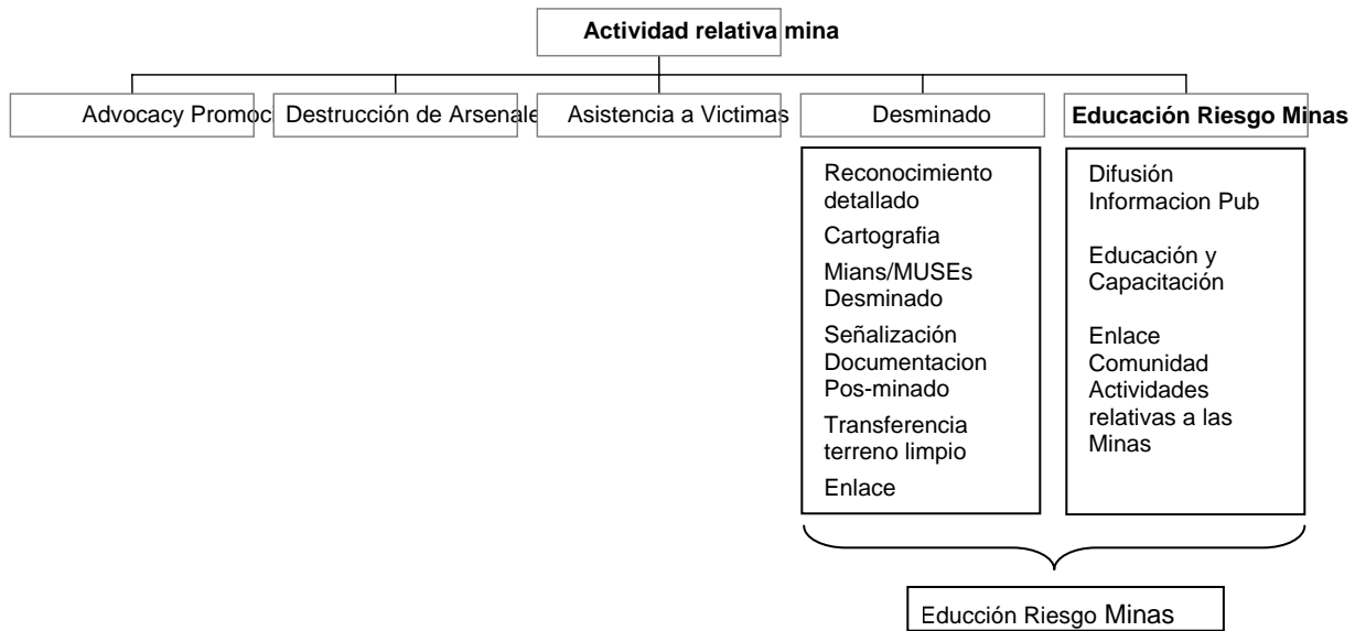
Figura 1: Relación entre EMR, reducción del riesgo de minas y minas

La educación en el riesgo de las minas o desminado (incluido el reconocimiento detallado, cartografía, remoción de minas y municiones sin estallar, señalización, documentación posterior al desminado y el traspaso del terreno desminado) contribuye a reducir el riesgo de las minas al reducir el riesgo de daño físico provocado por las minas y municiones sin estallar que ya contaminan el terreno. La promoción (“advocacy”) y la destrucción de arsenales tiene por objeto prevenir el uso futuro de minas y municiones sin estallar. La asistencia a las víctimas se ocupa del cuidado, rehabilitación y reintegración de los sobrevivientes de minas antipersonal. La relación entre las actividades relativas a las minas, la reducción del riesgo de minas y la educación en el riesgo de minas aparecen ilustradas en la Figura 1.